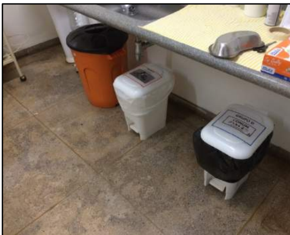
Figura 7: Unidades de saúde em Araporã, segregação e armazenamento dos RSSS.