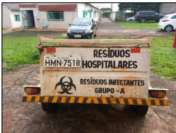
Figura 1: Reboque para coleta e transporte de resíduos de serviços de saúde de geradores públicos no município de Araporã.