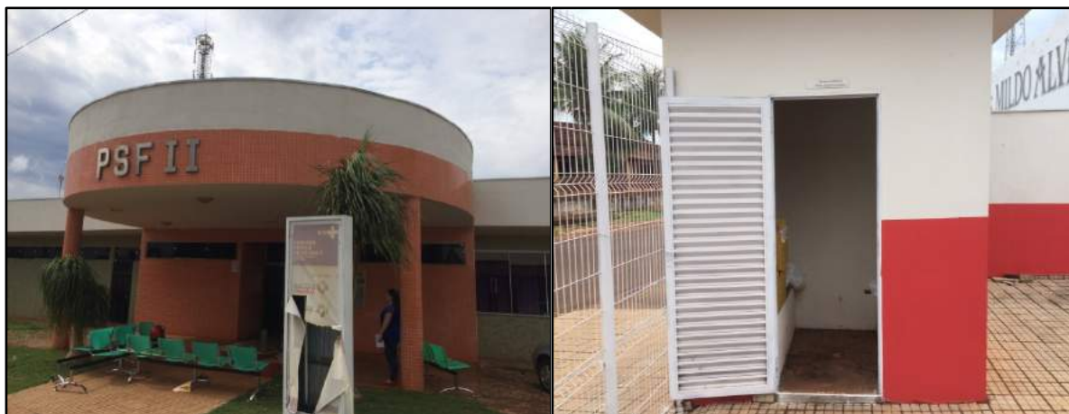
Figura 4: Unidades de saúde em Araporã, segregação e armazenamento dos RSSS.