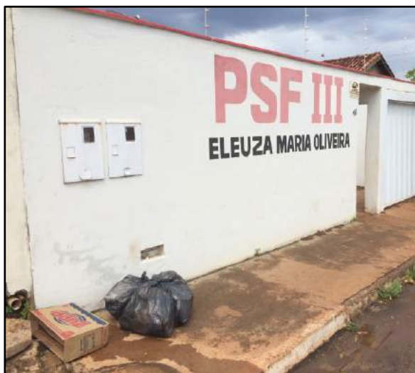
Figura 9: Unidades de saúde em Araporã, segregação e armazenamento dos RSSS.