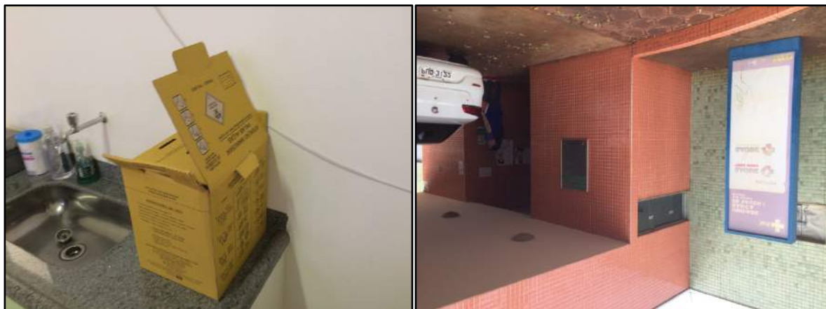
Figura 5: Unidades de saúde em Araporã, segregação e armazenamento dos RSSS.