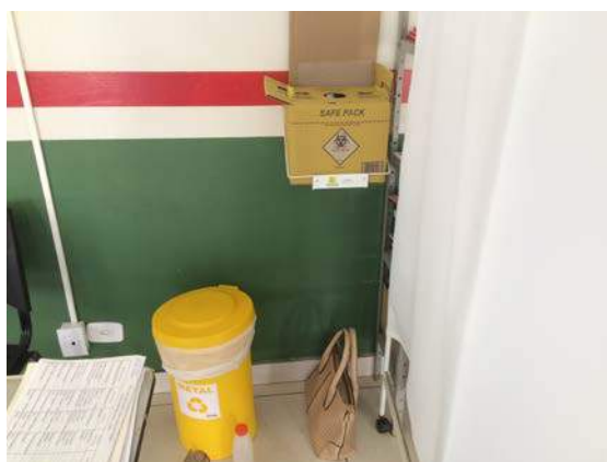
Figura 5: Segregação de RSSS nas unidades de saúde de Canápolis.