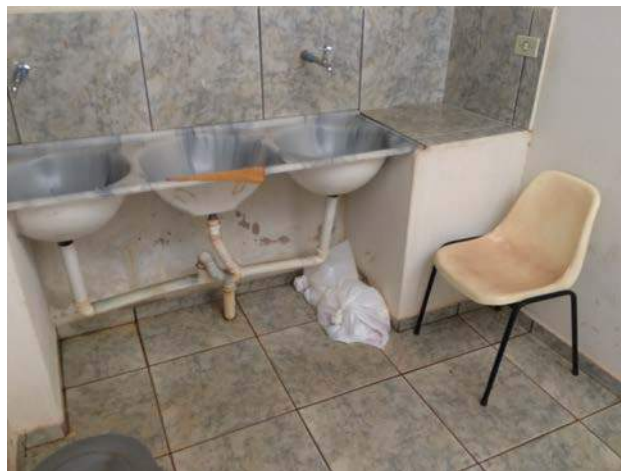
Figura 9: PSF II – Dr. Osvaldo Pinto, local onde são armazenados os RSSS.

Nos PSF III, PSF IV e Santa Casa de Misericórdia de Canápolis os RSSS são armazenados em locais apropriados, com acesso externo e boa ventilação, porém os resíduos sólidos comuns (recicláveis) e materiais de limpeza estão sendo armazenados junto com os RSSS. Este procedimento é inadequado já que os RSSS são contaminados e podem contaminar os outros tipos de materiais (Figuras 10, 11 e 12).