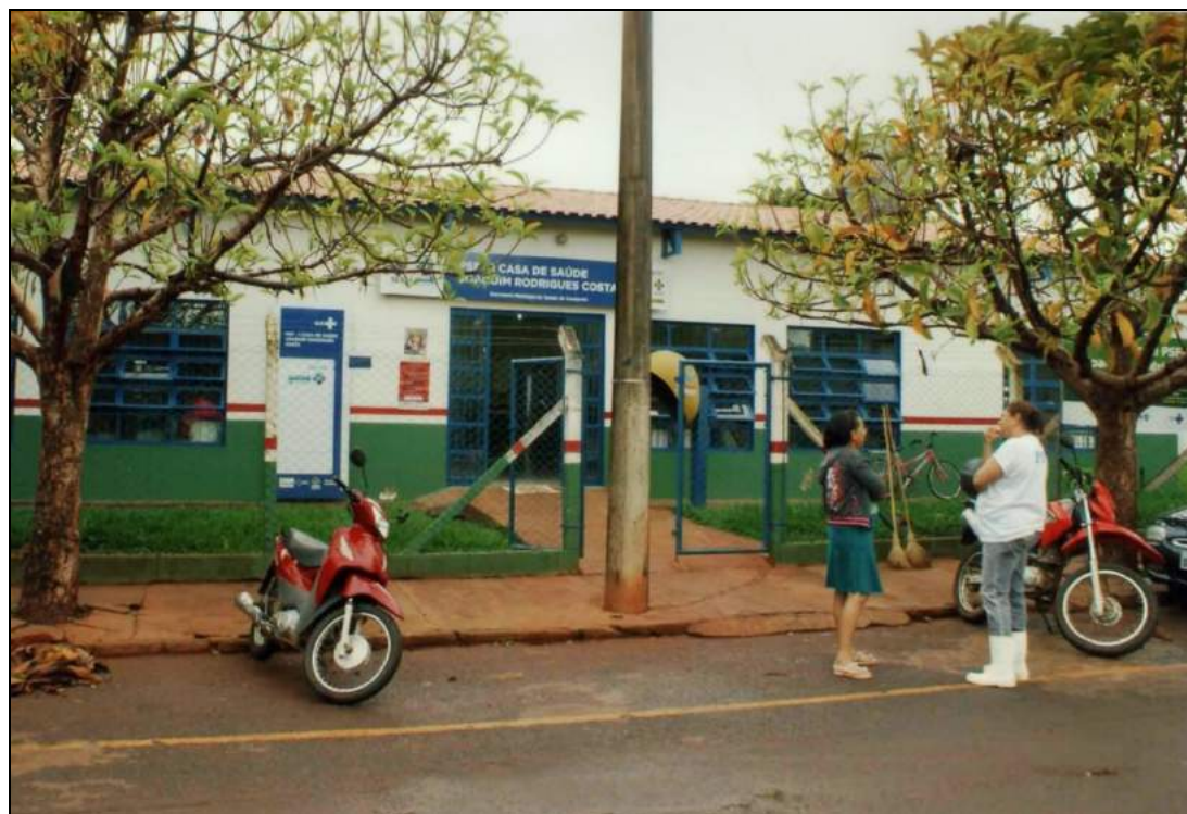
Figura 1: Unidade Básica de Saúde da Família Casa de Saúde Joaquim Rodrigues Costa em Canápolis.