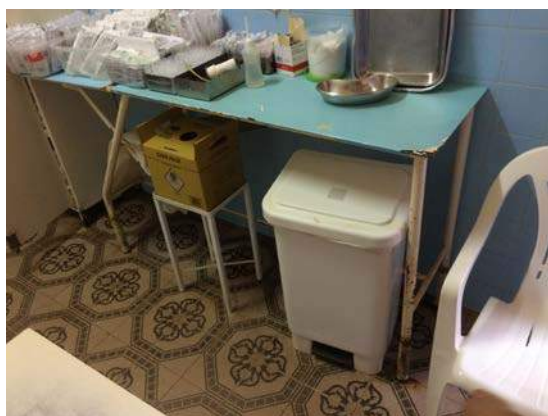
Figura 7: Segregação de RSSS nas unidades de saúde de Canápolis.