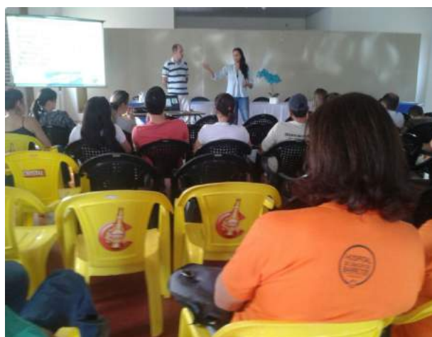
Figura 4: Palestra sobre saúde ambiental e sustentabilidade.

No dia 22/09/2016, ocorreu a palestra (Figuras 6 e 7) de saúde ambiental e sustentabilidade, discutiu-se desde o surgimento do saneamento básico nas cidades até os dias atuais e como a falta desse saneamento interfere na salubridade ambiental e qualidade de vida. Também, foi apresentado o conceito de sustentabilidade e de que forma é possível conquistá-la a partir de pequenas ações locais, de cooperação no planejamento e implementação das ações, com a responsabilidade dos gestores buscando o bem coletivo. Ocorreu também a oficina (Figuras 8 e 9) de material reciclado para estimular práticas sustentáveis e reuso de materiais que normalmente são direcionados ao lixo comum. No período da tarde foi realizado a mobilização porta a porta (Figuras 10 e 11), que teve como objetivo orientar a comunidade quanto a separação correta do resíduo doméstico (Figura 12).