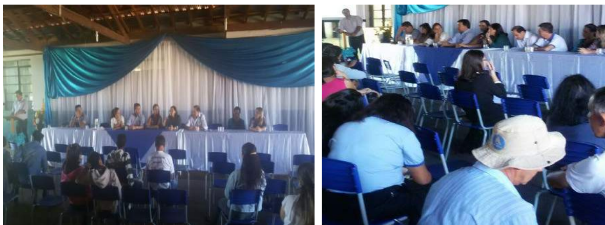
Figura 2: Primeira audiência pública.

No dia 28/06/2016 ocorreu o seminário de capacitação (Figuras 4 e 5) para implantação da coleta seletiva, com o objetivo de apresentar a legislação a respeito dos resíduos sólidos urbanos (RSU), resíduos dos serviços de saúde e a forma de armazenamento, normas e classificação dos materiais por tipo. Também foi discutida a importância da participação dos catadores de materiais recicláveis e reutilizáveis, conforme a Lei 12.305/10. Apresentou-se como funciona um aterro sanitário e um lixão, bem como os seus impactos ambientais decorrentes das práticas inadequadas no tratamento dos RSU e os fundamentos da implantação da coleta seletiva, passo a passo. Ao final da apresentação, teve início a reunião técnica, realizada com a presença do prefeito e secretários, que teve como objetivo a definição