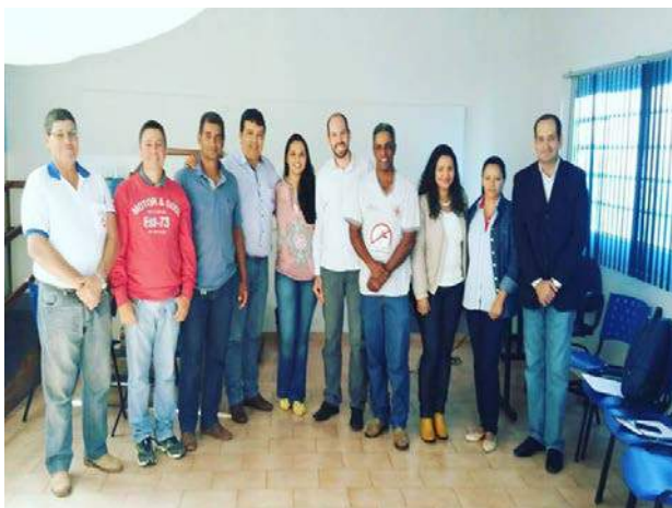
Figura 3: Reunião técnica com Prefeito, secretários municipais e capacitação em Gurinhatã - MG.