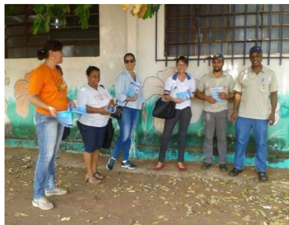
Figura 7: Folder de divulgação da coleta seletiva.