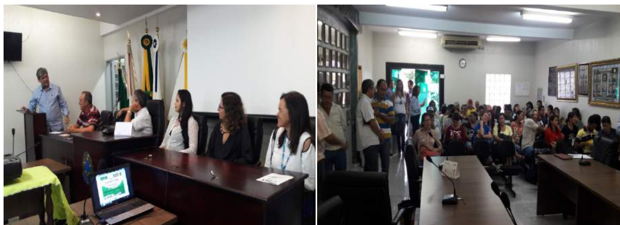
Figura 8: Audiência final