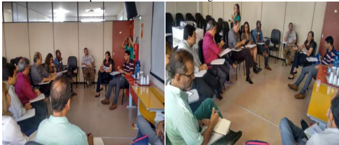
Figura 3: Reunião com o prefeito e secretários para definir as estruturas necessárias para atender as medidas emergenciais.: Reunião com o prefeito e secretários para definir as estruturas necessárias para atender as medidas emergenciais.