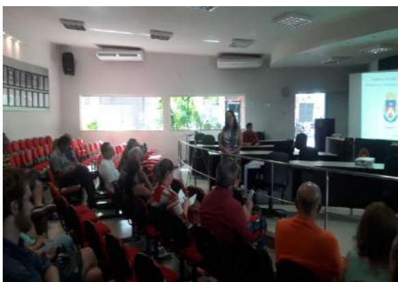
Figura 8: Audiência Final.