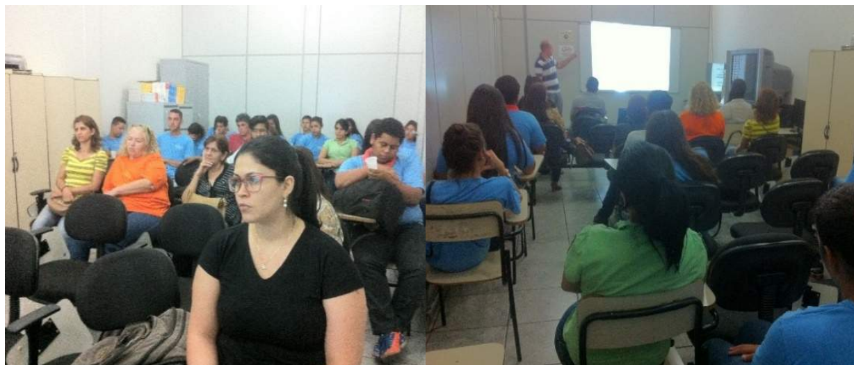
Figura 7: Palestra sobre saúde ambiental e sustentabilidade e oficina de composteira caseira.