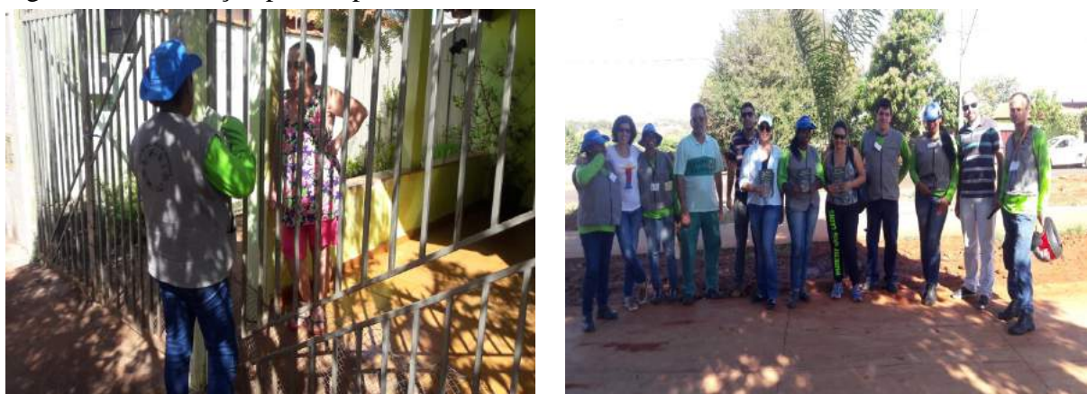
Figura 5: Mobilização porta a porta.

Em cumprimento a mais uma etapa de implantação e/ou ampliação da coleta seletiva, no dia 15/09/2016 foi realizado a mobilização porta a porta (Figura 5), que teve como objetivo orientar a comunidade quanto à separação correta no resíduo doméstico (Figura 7).