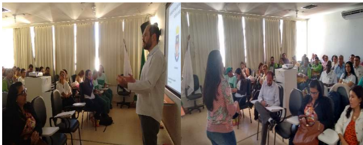
Figura 4: Seminário de capacitação.

Em cumprimento a mais uma etapa de implantação e/ou ampliação da coleta seletiva, no dia 15/09/2016 foi realizado a mobilização porta a porta (Figura 5), que teve como objetivo orientar a comunidade quanto à separação correta no resíduo doméstico (Figura 7).