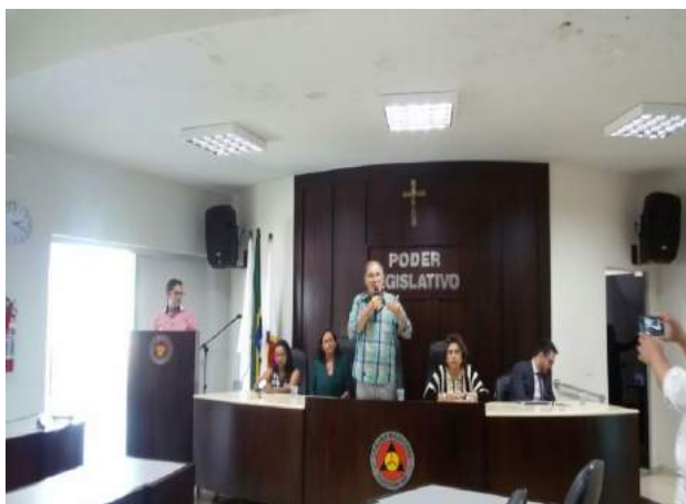
Figura 2: Primeira audiência pública.