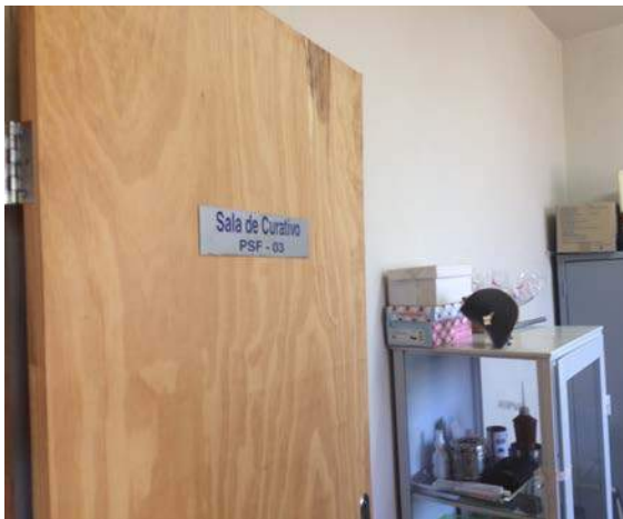
Figura 17: PSF 3 – Novo Tempo II. Segregação de RSSS.