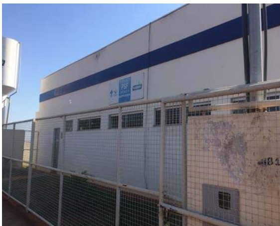
Figura 9: PSF 9 - Independência. Segregação de RSSS.