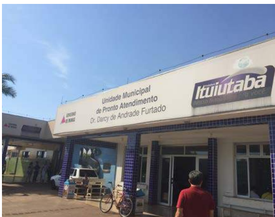
Figura 5: UPA Darcy de Andrade Furtado. Segregação de RSSS.