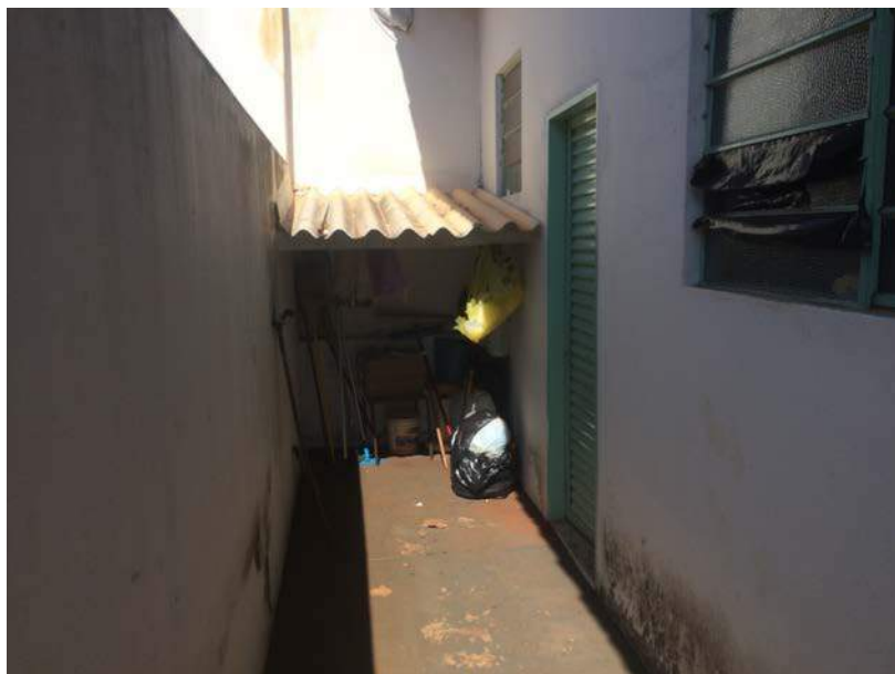
Figura 19: Local onde são armazenados os RSSS no Centro de Saúde Saul de Oliveira Carvalho.

Nas unidades de saúde, Unidade de Pronto Atendimento, PSF Setor Norte – Unidade 11, PSF Independência – Unidade 9 e PSF Novo Tempo 2 – Unidade 5, não