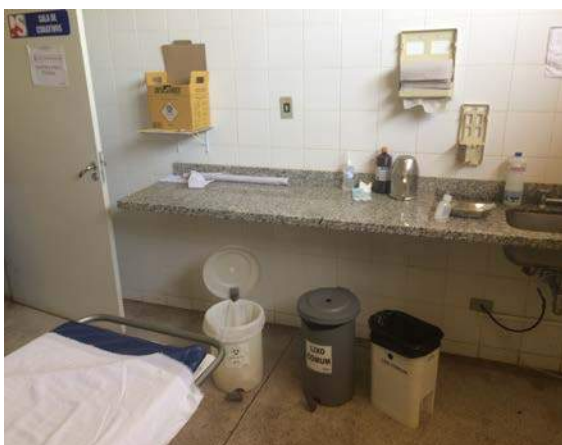
Figura 7: UPA Darcy de Andrade Furtado. Segregação de RSSS.