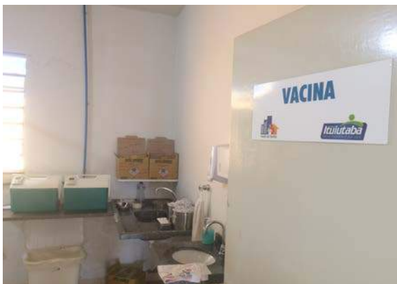
Figura 12: Centro de Saúde “Saul de Oliveira Carvalho”. Segregação de RSSS.