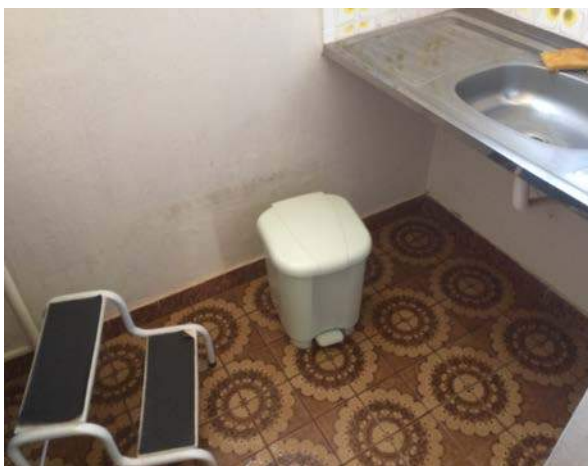
Figura 4: PSF – Unidade 11 – Setor Norte, segregação de RSSS.