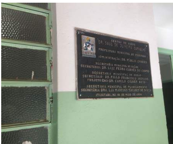
Figura 14: Centro de Saúde “Saul de Oliveira Carvalho”. Segregação de RSSS.