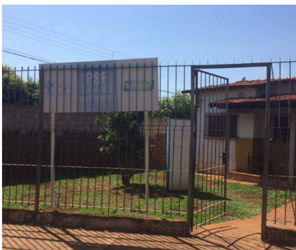
Figura 16: PSF 3 – Novo Tempo II. Segregação de RSSS.