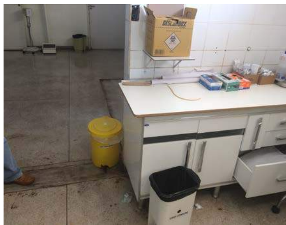
Figura 6: UPA Darcy de Andrade Furtado. Segregação de RSSS.