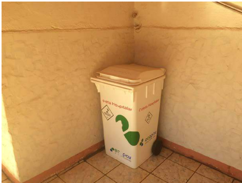
Figura 21: Pronto Socorro – Unidade Municipal de Pronto Atendimento – Armazenamento de RSSS.