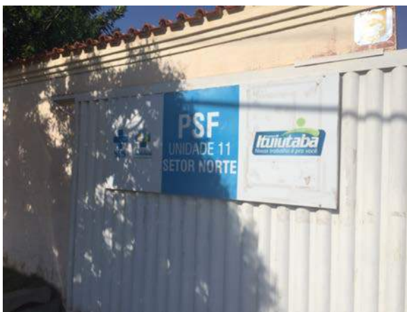
Figura 2: PSF – Unidade 11 – Setor Norte, segregação de RSSS.