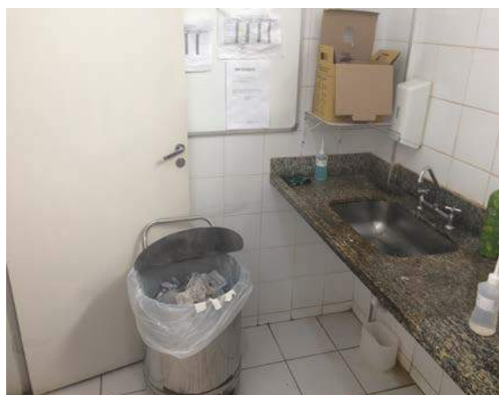
Figura 8: UPA Darcy de Andrade Furtado. Segregação de RSSS.