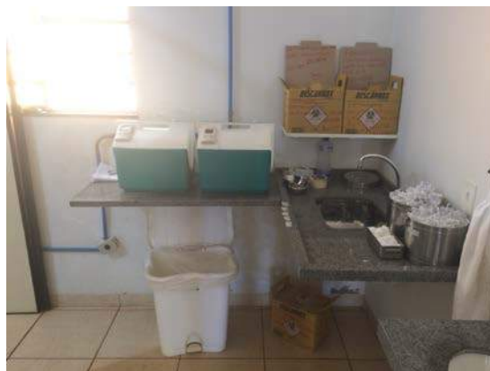
Figura 13: Centro de Saúde “Saul de Oliveira Carvalho”. Segregação de RSSS.