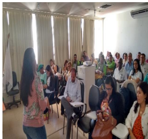
Figura 22: Orientação porta-a-porta e oficina de compostagem no município de Ituiutaba – MG.