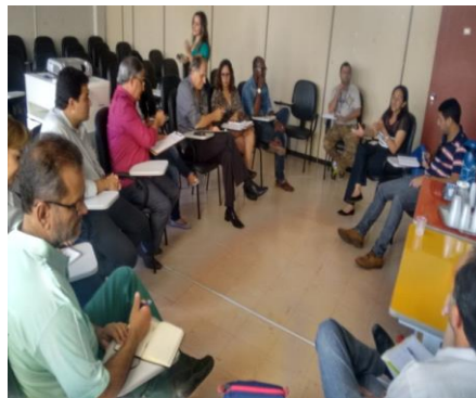
Figura 21: Seminário de capacitação no município de Ituiutaba – MG.