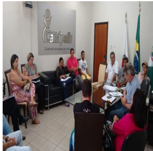
Figura 6: Reunião para criação da associação dos catadores de materiais recicláveis em Canápolis – MG.