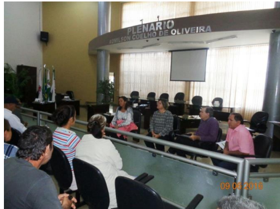
Figura 7: Seminário de capacitação no município de Canápolis – MG.