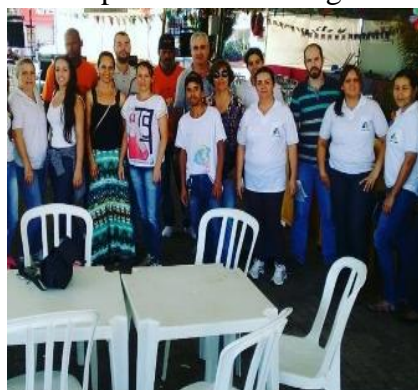
Figura 18: Reunião com o prefeito e secretários municipais para definir as estruturas necessárias para atender as medidas emergenciais no município de Prata – MG.