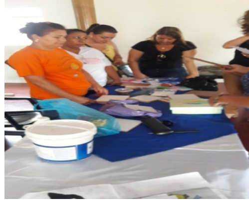
Figura 13: Mobilização porta a porta no município de Gurinhatã – MG.