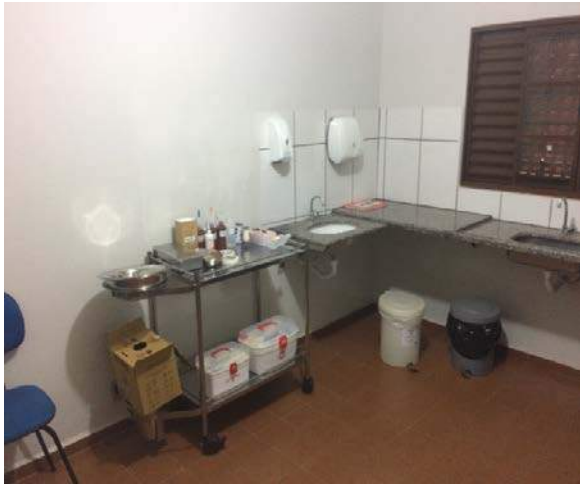
Figura 5: Segregação e armazenamento dos RSSS – PSF José Nilton de Medeiros.