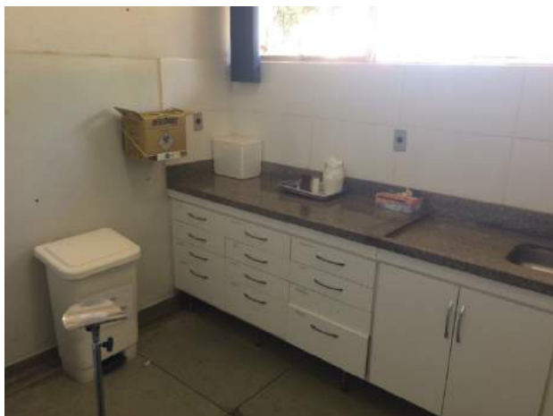
Figura 11: Segregação e armazenamento dos RSSS – UPA Jerônimo Teodoro.