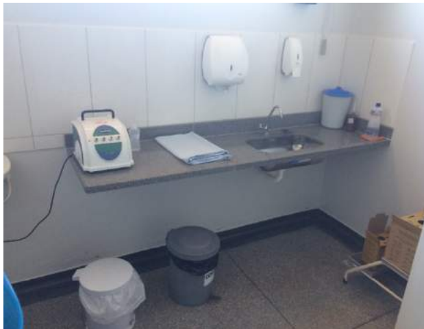
Figura 9: Segregação e armazenamento dos RSSS – PSF Isidoro cândido Ferreira.