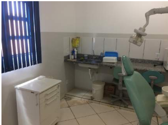
Figura 1: Segregação e armazenamento dos RSSS – PSF Vicente Bonito.